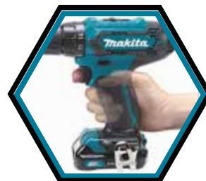
Kompakt und leicht.